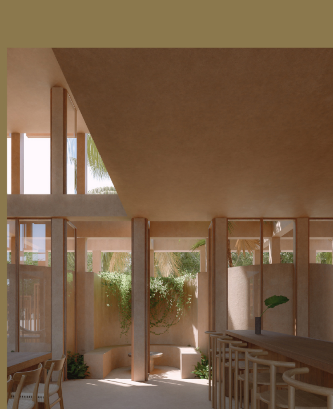
ÁREA DEL BAR