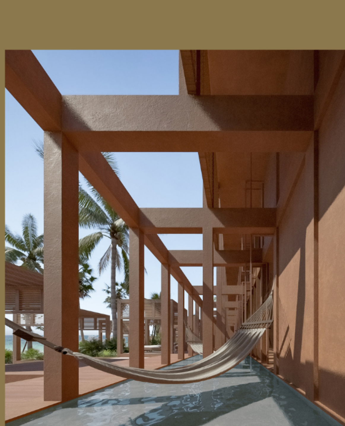
ÁREA DE HAMACAS